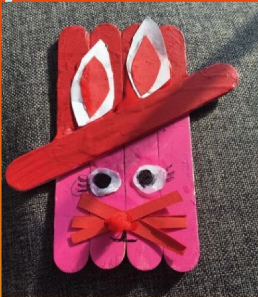
Art by Evangeline